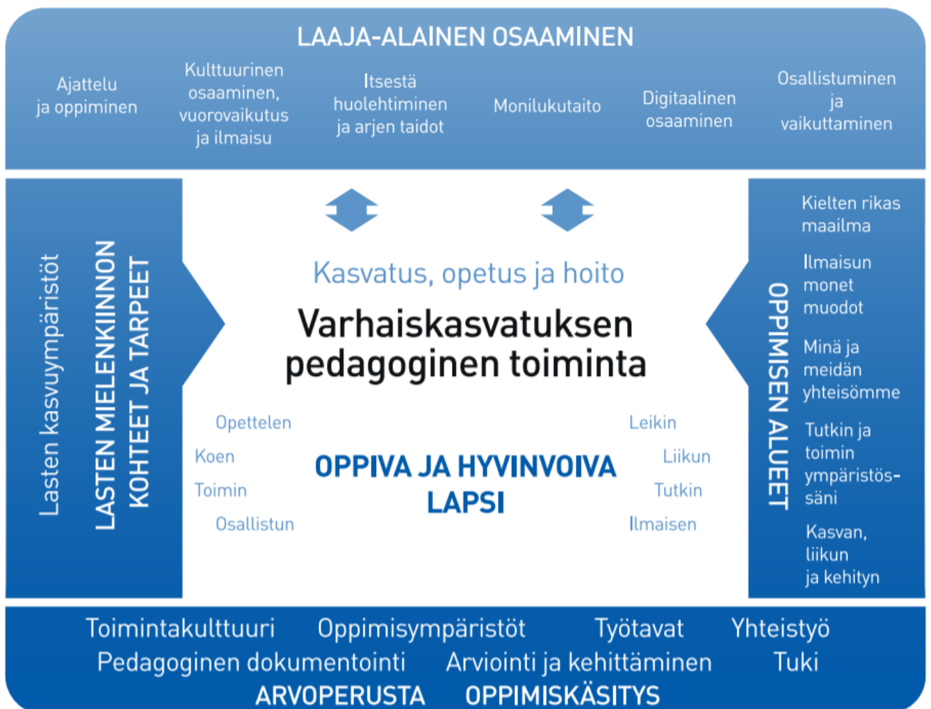
Kuvio 1. Varhaiskasvatuksen pedagogisen toiminnan viitekehys

Varhaiskasvatuksen pedagogista toimintaa ja sen toteuttamista kuvaa kokonaisvaltaisuus. Tavoitteena on edistää lasten oppimista ja hyvinvointia sekä laaja-alaista osaamista (kuvio 1). Pedagoginen toiminta toteutuu lasten ja henkilöstön välisessä vuorovaikutuksessa ja yhteisessä toiminnassa. Lasten omaehtoinen, henkilöstön ja lasten yhdessäideoima sekä henkilöstön suunnittelema toiminta täydentävät toisiaan. Varhaiskasvatuksen pedagoginen toiminta läpäisee kasvatuksen, opetuksen ja hoidon kokonaisuuden.